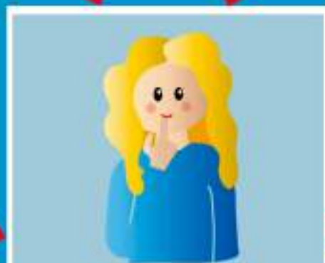
ПРИКОСНОВЕНИЕ К ЛИЦУ, ГЛАЗАМ, НОСУ, РТУ