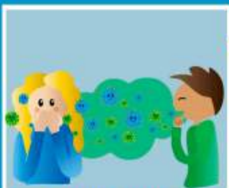
КАШЕЛЬ, ЧИХАНИЕ (ВОЗДУШНО-КАПЕЛЬНЫМ ПУТЕМ)