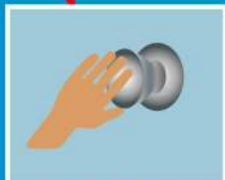
КОНТАКТ С ЗАГРЯЗНЕННЫМИ ПОВЕРХНОСТЯМИ