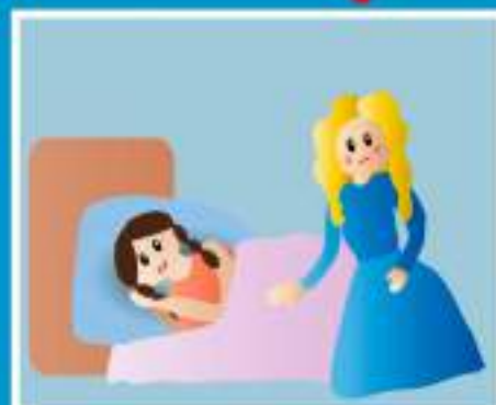
УХОД ЗА БОЛЬНЫМИ